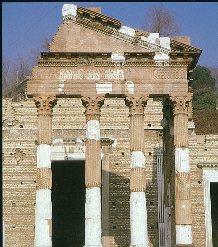
BRESCIA, TEMPIO CAPITOLINO

STRIPP 111 LIQUIDO Detergente liquido per eliminare le scritte murali